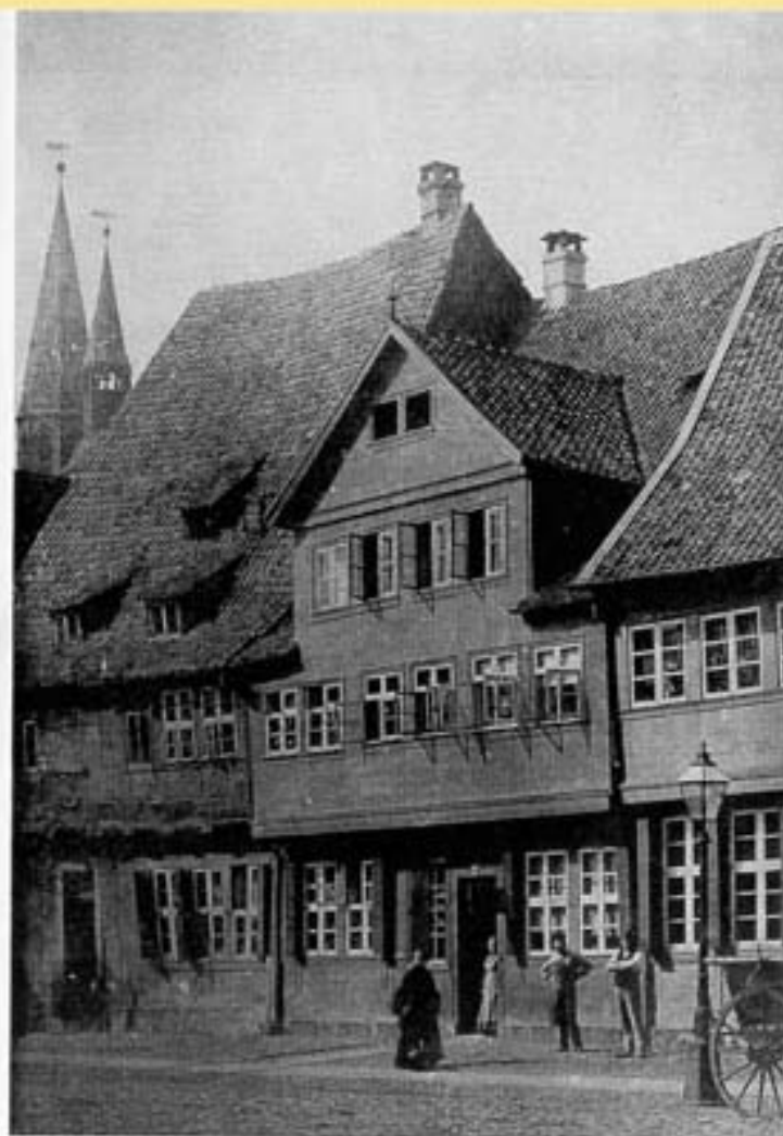
The birthplace of C. F. Gauss in Brunswick (picture taken 1884), which was destroyed in World War II