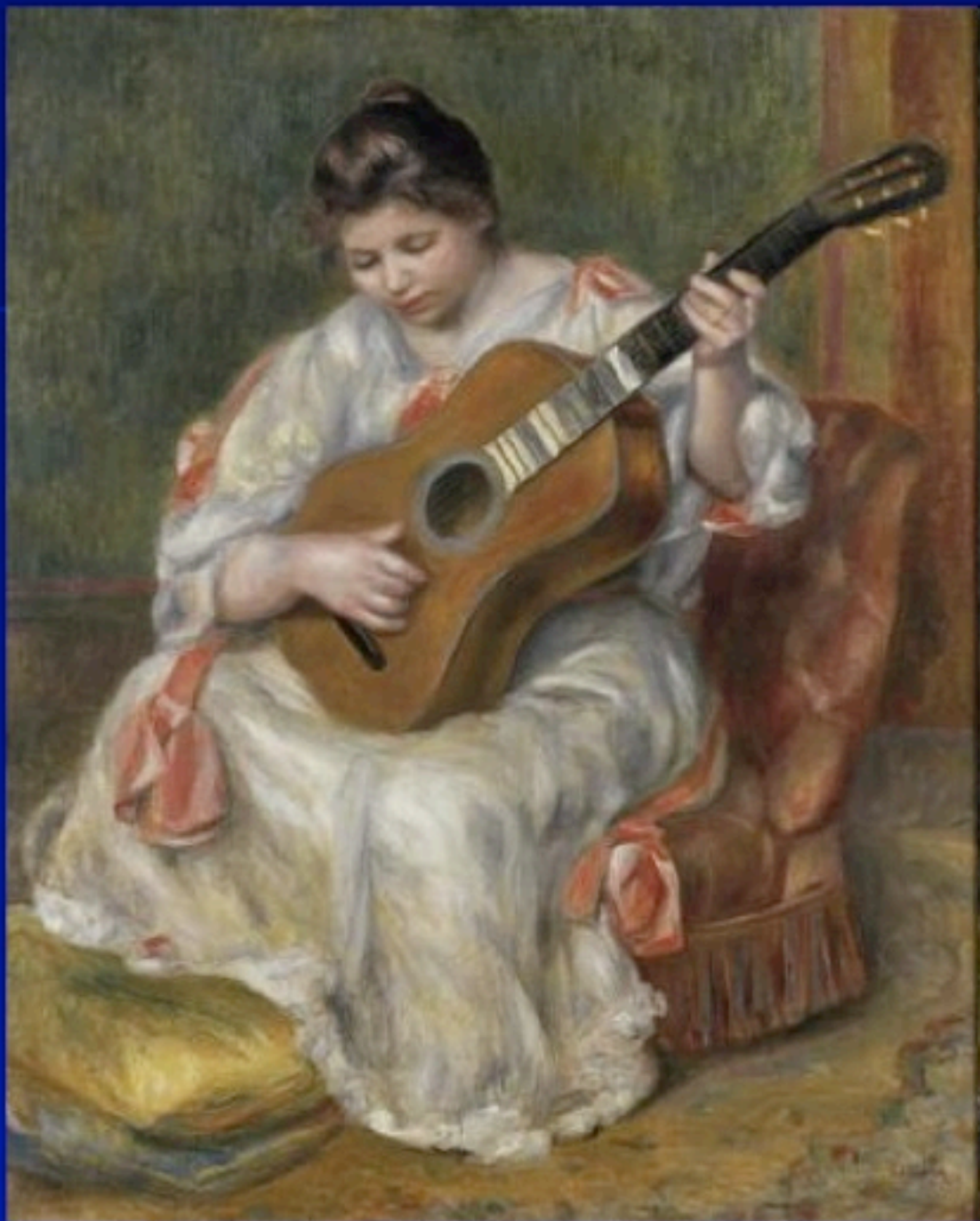
Pierre-Auguste Renoir : Η γυναίκα με την κιθάρα 1896-97