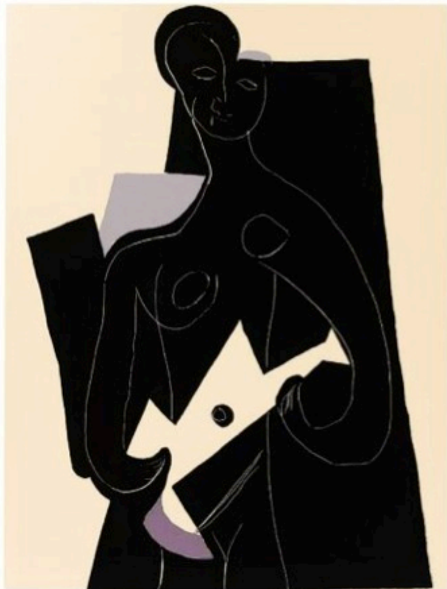
Pablo Picasso Η γυναίκα με την κιθάρα 1924