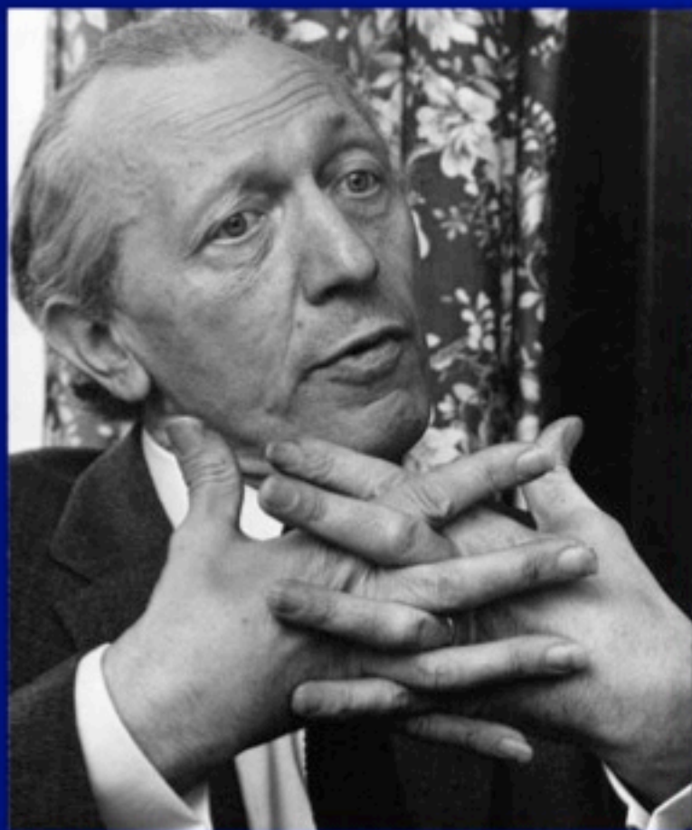
Andre Lichnerowicz Z