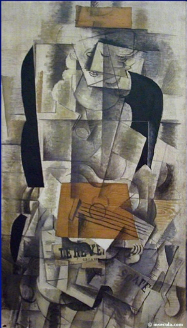
Georges Braque Η γυναίκα με την κιθάρα 1913