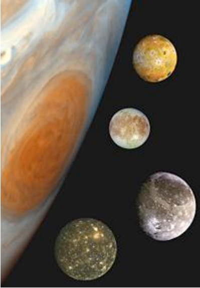
Από πάνω προς τα κάτω: Ιώ, Ευρώπη, Γανυμήδης και Καλλιστώ